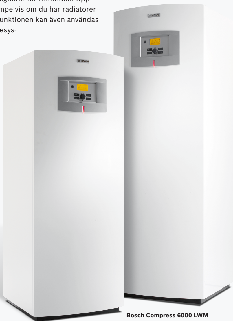
Bosch Compress 6000 LW